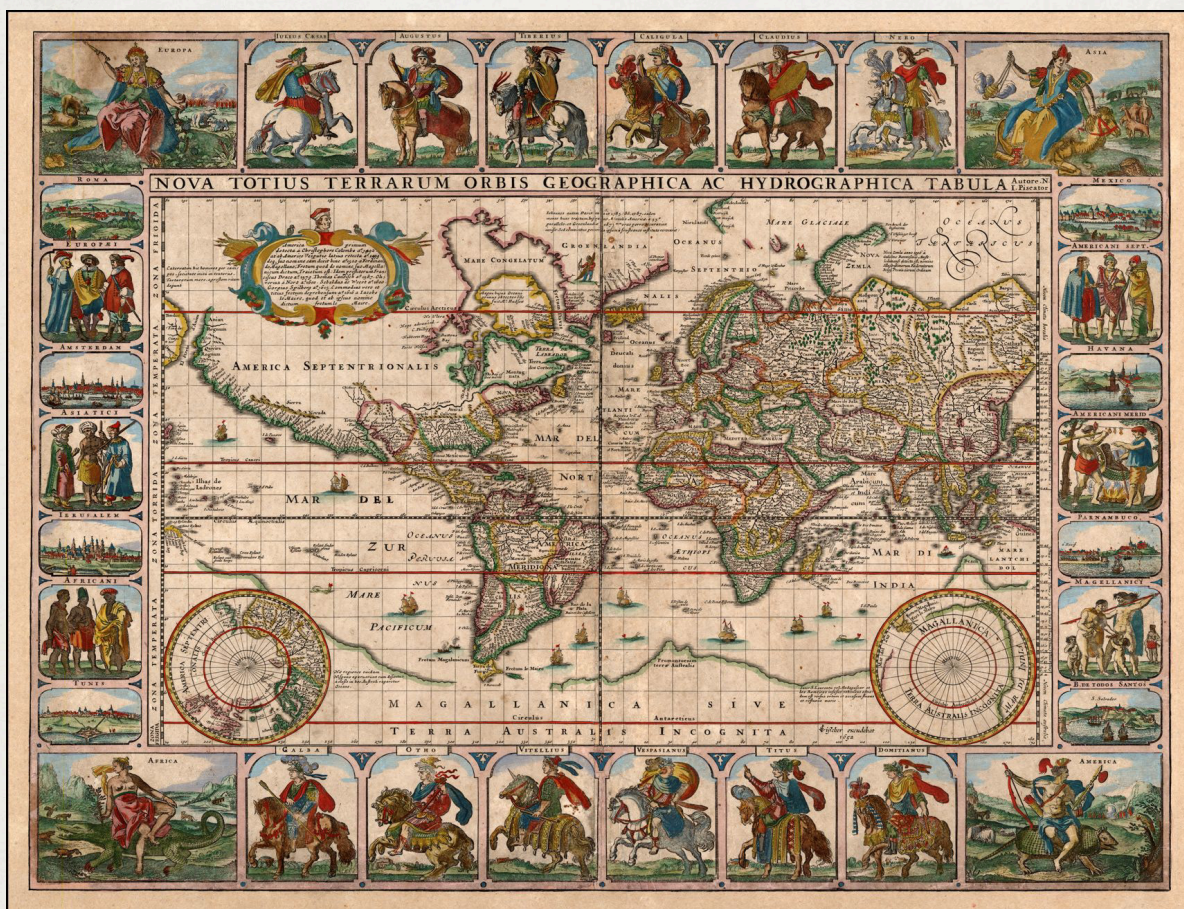
G. Blaeu - siglo XVII

Antes que el sueño (o el terror) tejiera mitologías y cosmogonías Antes que el tiempo se acuñara en días, el mar el siempre mar, ya estaba y era.