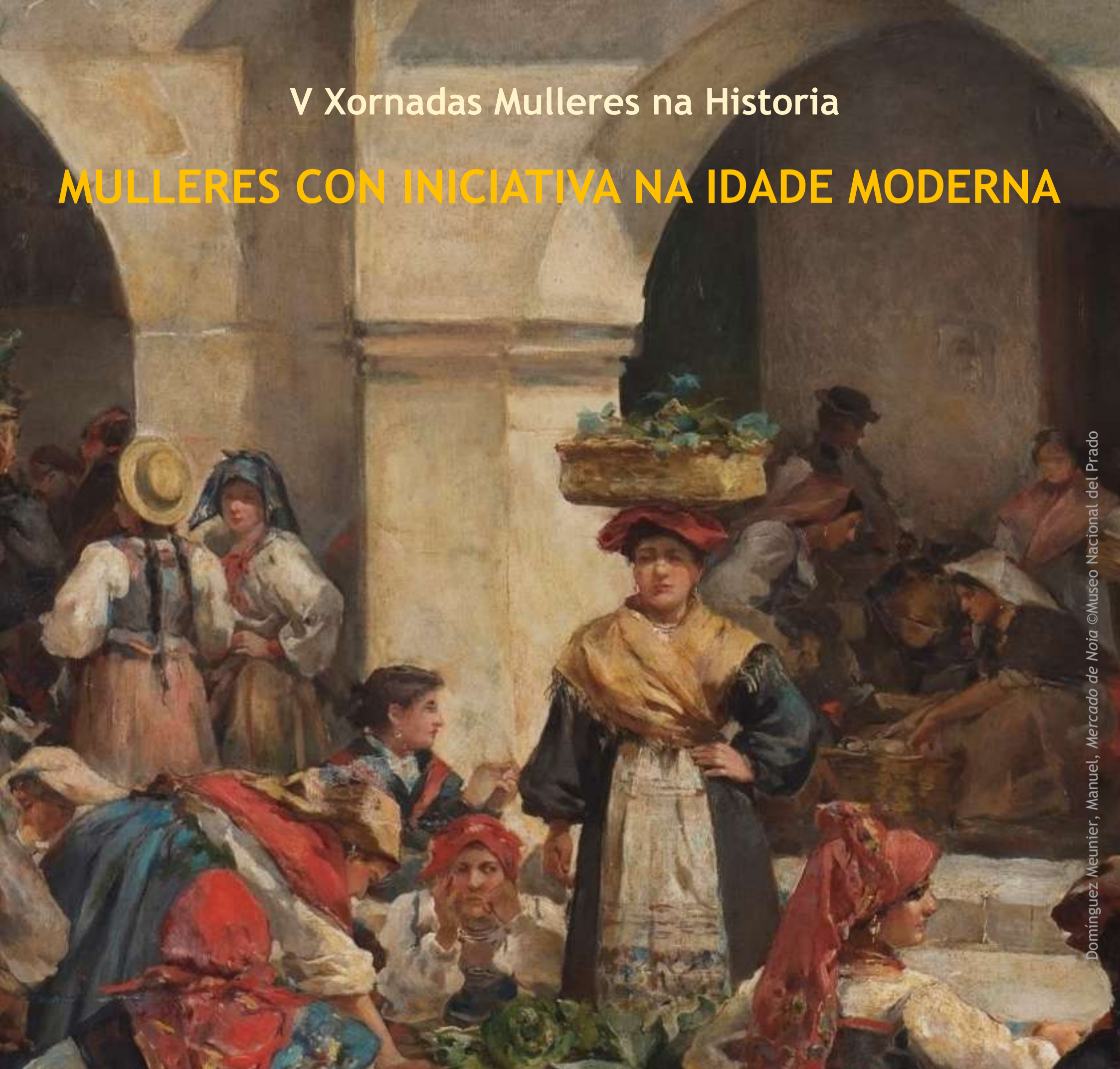
Domínguez Meunier, Manuel, Mercado de Noia

Facultade de Xeografía e Historia (USC), Aula 12